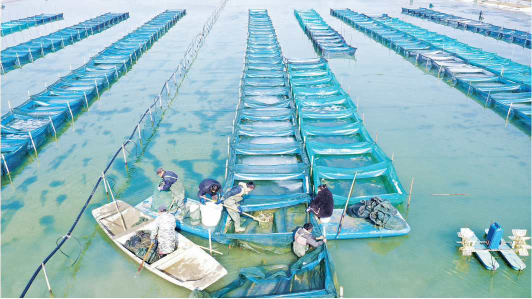
春节临近,洪泽区水产养殖户抢抓节庆消费商机,捕捞大闸蟹供应省内外大中城市水产品市场,实现了农业增效、农民增收。图为近日,洪泽区一大闸蟹养殖基地,工人在破冰捕捞大闸蟹。