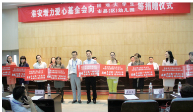
在淮阴工学院举行捐赠仪式

金会为盱眙县古城小学的200名留守儿童每人捐赠了一个价值100元的“四季平安盒”，用这份小小的关爱温暖孩子们的心灵。在高等教育领域，淮安增力爱心基金会持续发挥示范效应。自2012年起，基金会每年在本市一所高校资助20名家庭经济困难的大一新生，每人给予3000元资助，五年累计捐赠金额达30万元。此外，基金会积极参与“光彩感恩教育行”等公益活动，并于2012年10月向清浦中学捐赠10万元，以实际行动践行尊师重教的社会担当。十五年来，基金会在教育助学方面累计投入超300万元，捐赠学校20余所，资助困难学生1000余名，为淮安教育事业的均衡发展注入了强劲动力。正如一位受助大学生在感谢信中所说：“增力爱心基金会的帮助，不仅解决了我们的学费难题，更让我们感受到了社会的温暖，这份爱心将激励我们努力学习，将来回报社会。”