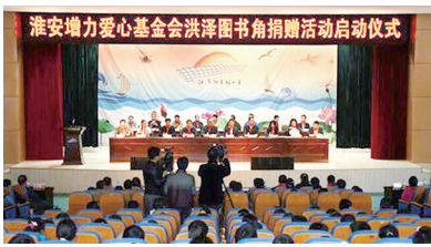
洪泽图书角捐赠活动