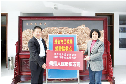
通过淮安市民政局向四川雅安地震灾区捐款