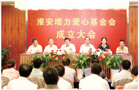
淮安增力爱心基金会成立大会会场