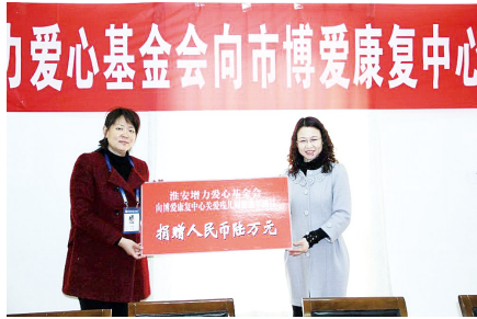
在淮安市博爱康复中心向“关爱残儿·圆梦童年”项目捐款

“公益的本质，是用一束光点亮另一束光，用一份温暖传递另一份温暖。”十五年来，淮安增力爱心基金会始终聚焦困难群众的急难愁盼问题，在灾害救助、医疗帮扶、生活扶持等领域持续发力，成为困难群众的“暖心人”。在灾害救助方面，基金会反应迅速、行动有力。2008年汶川地震和2013年雅安地震发生时，李增力均以个人或企业名义向灾区捐赠10万元。基金会成立后，更是将灾害救助纳入重点工作，第