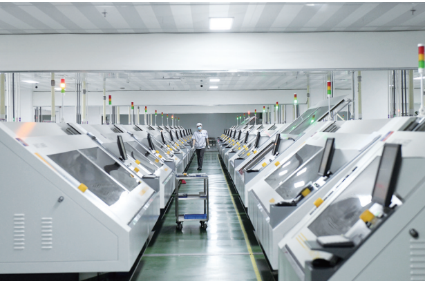
特创科技印制线路板生产车间