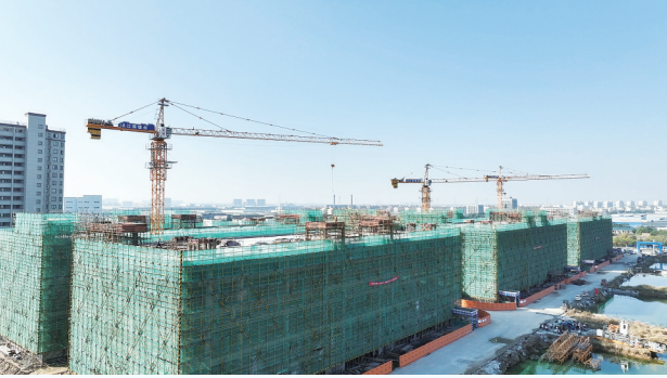
涟水经济开发区科创园