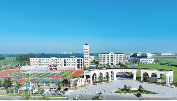
郑梁梅学校清枫路校区

障了项目“拎包入住”，即时投产，为开发区的高质量发展积蓄澎湃的空间动能。 塔吊的轰鸣依旧铿锵，机器的运转声愈发激昂。站在新的历史起点上，涟水经济开发区正以更加昂扬的姿态，在高质量发展的赛道上全速奔跑，用笃实的行动与担当，奋力书写下一个跨越发展的崭新篇章。