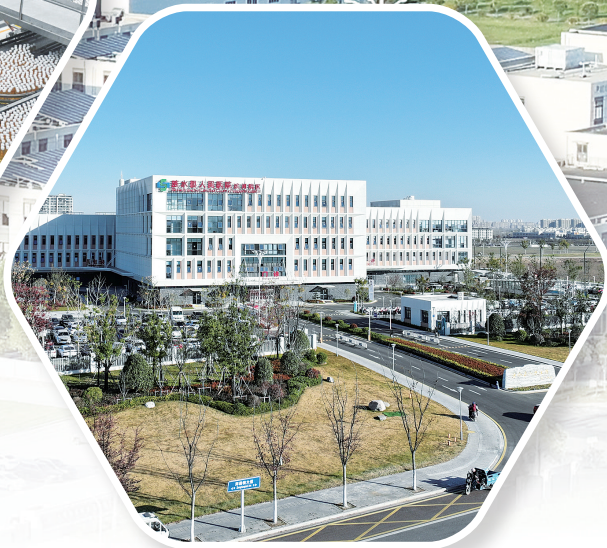
涟水县人民医院滨河院区

冬日寒意，挡不住涟水发展的滚滚热浪。走进涟水经济开发区，道路两旁现代化厂房鳞次栉比，车间内机器轰鸣，重大项目工地上塔吊挥舞、车辆穿梭，飞溅的焊花映照出一派实干争先、生机勃勃的火热景象。 五年砥砺前行，五载跨越前行。作为涟水县经济社会发展的主阵地、主力军和主引擎，涟水经济开发区始终以“敢拼敢闯、敢为人先”的奋进姿态，全面深化改革，加速转型升级，成功推动动力活力“双增强”，业态形态“双提升”，综合实力跃升至全省省级开发区第15位、苏北地区第3位，获评2025年度“江苏省绿色工业园区”称号，跻身全国省级开发区高质量发展500强榜单，涟水县PCB电子元器件产业集群获评江苏省中小企业特色产业集群，交出了一份亮眼的高质量发展答卷。